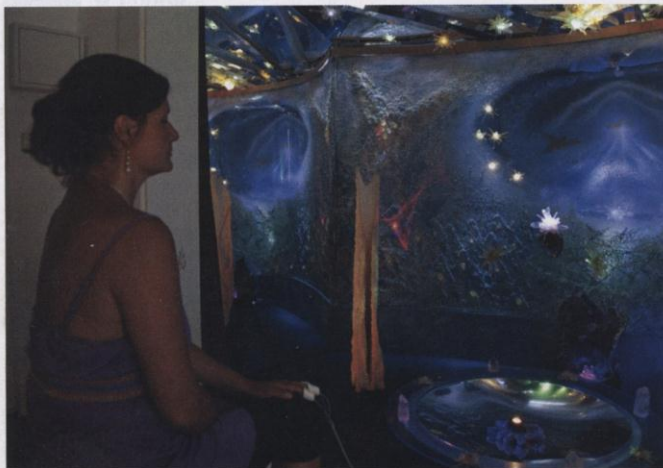
▲ Díky projektu Labyrint světa a ráj srdce jsem viděla, jak se mění moje emoce. V galerii si to může vyzkoušet každý návštěvník.